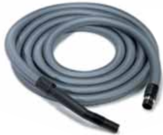
Ausführung wie CM 407