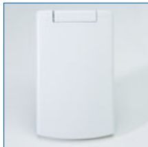
Frontansicht Saugdose Modell Classic