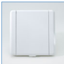
Frontansicht Saugdose Modell Ambiente