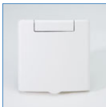
Frontansicht Saugdose Modell Tetra