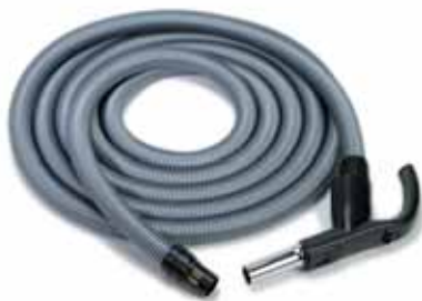
Ausführung wie CM 506S